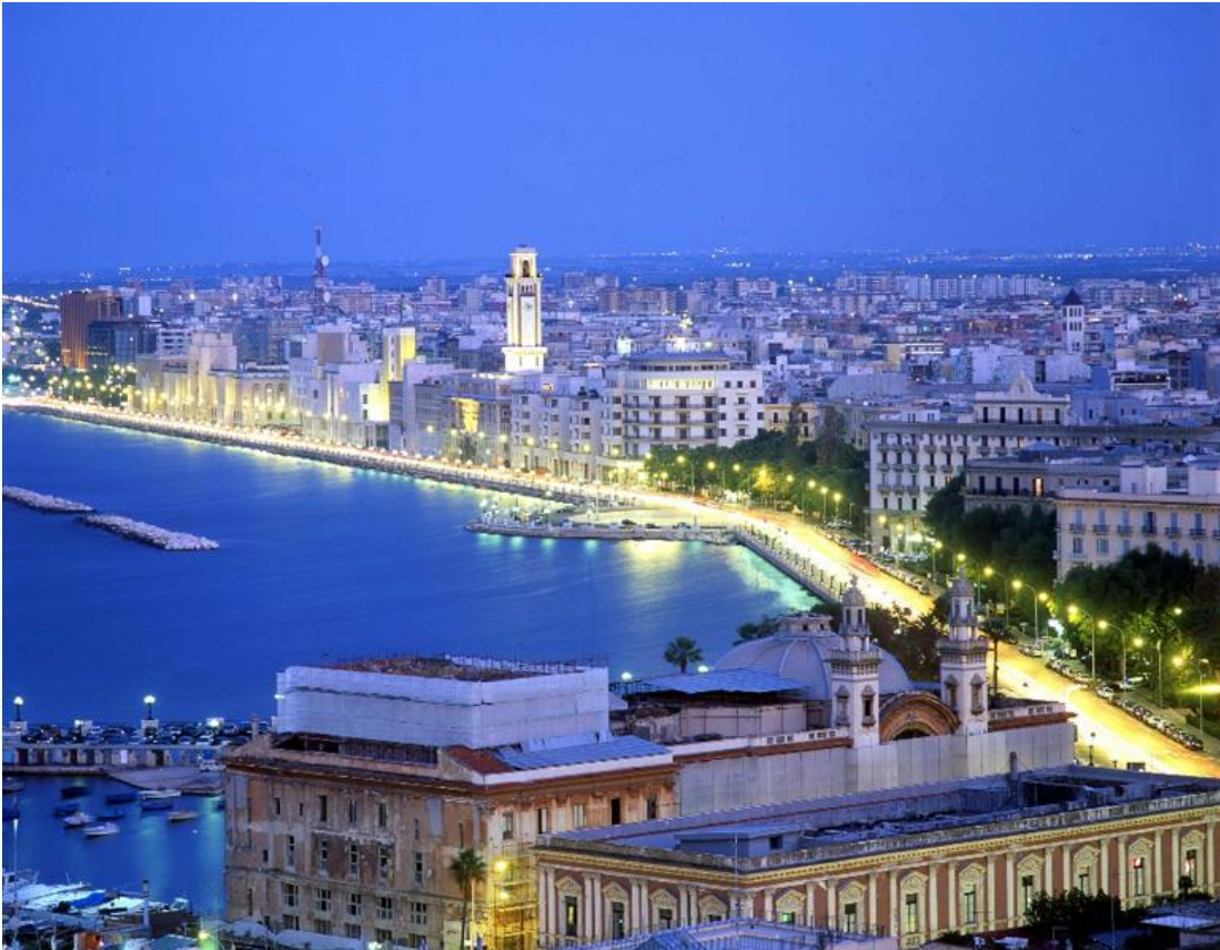
Bari. Lungomare.

La Parigi del Mediterraneo Commercio e cultura, chiese, palazzi sfarzosi e la grande muraglia sul mare. Una città piena di contraddizioni e di incontenibile vitalità di Lino Patruno