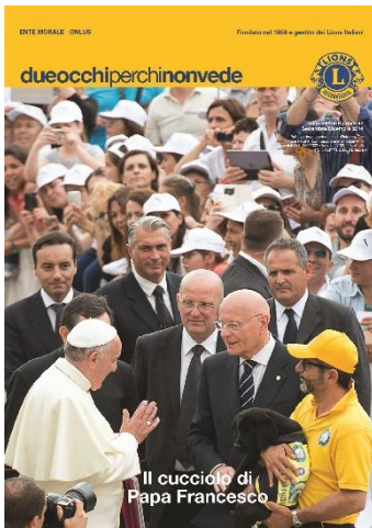
Copertina della Rivista della Scuola Cani Guida. 25 giugno 2014. Papa Francesco benedice un cucciolo di labrador in addestramento presso il Centro di Limbiate.