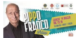
Pippo Franco, testimonial a Foggia per i Cani Guida dei Lions.

pensione perché inabile al lavoro e piano piano ho iniziato a chiudermi sempre di più in me stesso. Non uscivo, non parlavo con nessuno. Ero molto abbattuto, sconfortato, perché per qualunque cosa, o per andare in qualunque posto, avevo necessità di qualcuno».