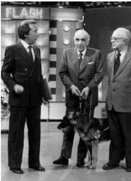
Responsabili della Scuola di Limbiate con un Cane Guida ad una trasmissione di Mike Buongiorno nel 1980.

Il 1986, e precisamente il 10 marzo, è una data da ricordare per la Scuola di addestramento. Il Presidente della Repubblica Italiana Francesco Cossiga firma il Decreto che riconosce al Servizio lo status di "Ente morale". Qualche anno dopo, 1991, la Scuola festeggia, con una cerimonia particolarmente emozionante e significativa, il simbolico traguardo della consegna del cane guida numero 1000.