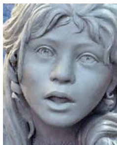
Particolare di una statua di Helen Keller

Da quasi 100 anni i nostri soci lavorano a progetti che hanno lo scopo di prevenire la cecità, restituire la vista, migliorare la salute degli occhi ed i servizi oculistici per centinaia di milioni di persone in tutto il mondo. Ciò anche attraverso la nostra Fondazione Internazionale, la LCIF (Lions Club International Fundation), almeno da quando esiste.