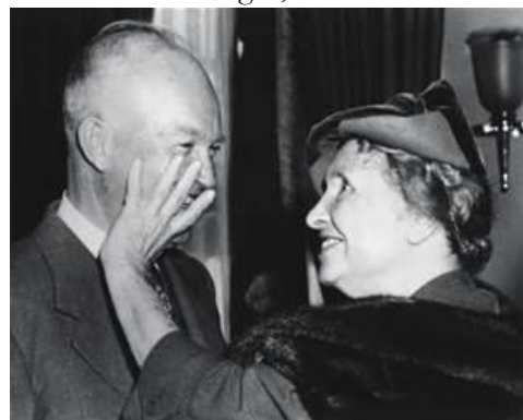
Helen Keller con Dwight David Eisenhower

La storia feconda e dell'allieva è stata riproposta nella rappresentazione teatrale e nel film “The miracle Worker” di William Gibson. La prima cosa, che la Sullivan chiese ed ottenne, fu il permesso del padre di isolare la bambina dal resto della famiglia, vivendo insieme a lei in una dependance, nel giardino di casa. Il primo obiettivo, infatti, era