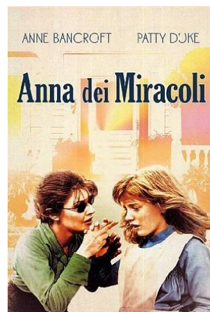
La locandina del film

Helen Keller è morta l'1 giugno 1968 nella sua casa di Easton (Connecticut) all'età di 87 anni.